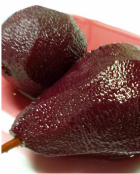
Poires au vin