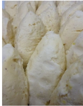
Quenelle de volaille maison