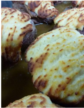
Noisette d'agneau au gratin de parmesan