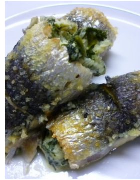
Sardines roulées à la brousse