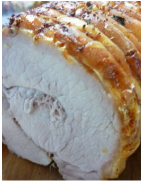
Rôti de porc